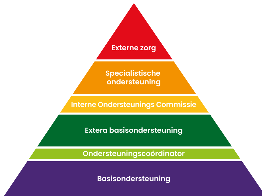
Ondersteuningsopbouw Da Vinci College Lammenschans

Bij het Da Vinci College Lammenschans hanteren wij een piramidemodel om onze ondersteuning vorm te geven. Deze piramide weerspiegelt de opbouw van de ondersteuning op school, van basisondersteuning tot intensieve externe zorg. Onze inzet is gericht op een sterke basis waar het grootste deel van onze leerlingen voldoende aan heeft. Wanneer dit niet voldoende blijkt, bouwen we de ondersteuning stapsgewijs uit, in samenwerking met ouders en externe partners.